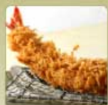
大海老かつ 1尾 980円 【卵・乳成分・小麦・えび】