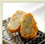
豚そぼろコロッケ 1個 260円 【卵・乳成分・小麦】