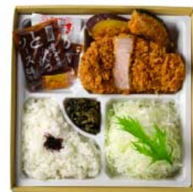
ロースかつ弁当 米沢三元豚 80g 1,100円 120g 1,400円 160g 1,700円 ロースかつ弁当 米沢三元豚 80g 1,400円 120g 1,800円 160g 2,200円 【卵・乳成分・小麦】