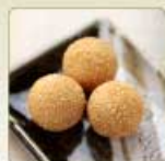
ごま団子 3個 200円 【卵・乳成分・小麦】