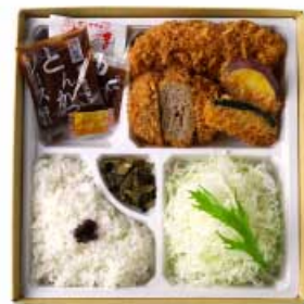
ミンチかつとヒレかつ弁当 【卵・乳成分・小麦】 1,720円