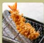
海老かつ 1尾 380円 【卵・乳成分・小麦・えび】