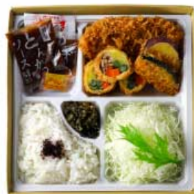
季節野菜の湯葉巻きかつと ヒレかつ弁当 1,660円 【卵・乳成分・小麦】