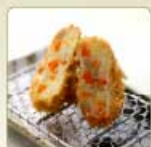
野菜コロッケ 1個 260円 【卵・乳成分・小麦】