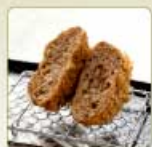
ミンチかつ 1個 420円 【卵・乳成分・小麦】