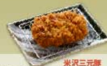
ヒレかつ 米沢三元豚 40g 700円 80g 1,240円 80g 1,100円 120g 1,640円 120g 1,300円 160g 2,040円 160g 1,600円 【卵・乳成分・小麦】