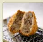
肉じゃがコロッケ 1個 260円 【卵・乳成分・小麦】