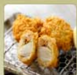
帆立かつ【青森県産】 1個 150円 【卵・乳成分・小麦】