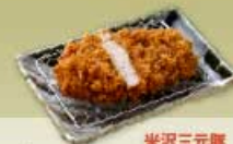
ロースかつ 米沢三元豚 80g 800円 80g 1,100円 120g 1,100円 120g 1,500円 160g 1,400円 160g 1,900円 【卵・乳成分・小麦】