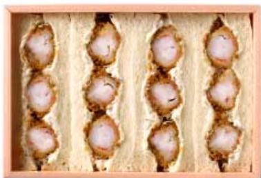
海老かつサンド 1,100円 【卵・乳成分・小麦・えび】