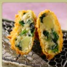
鯖と菜の花の 豆乳クリームコロッケ 1個 420円 【卵・乳成分・小麦】