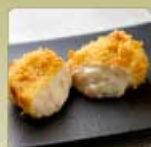
蟹クリームコロッケ 1個 560円 【卵・乳成分・小麦・えび・かに】