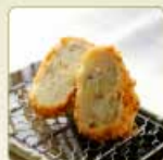
豚そぼろコロッケ 1個 260円 【卵・乳成分・小麦】