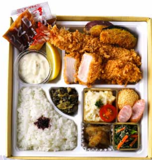
あじさい 紫陽花弁当 2,180円 (季節のおばんざいと、大海老かつ・ヒレかつ) 【卵・乳成分・小麦・えび】

春夏秋冬、 季節のめぐみをおばんざいに、 自慢のとんかつに添えた バランスの良いお弁当です。 京都の四季も堪能できる お弁当、会議やお宅でも。