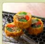
野菜の湯葉巻きかつ 1個 460円 【卵・乳成分・小麦】