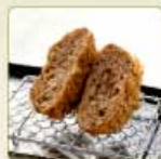
ミンチかつ 1個 420円 【卵・乳成分・小麦】