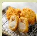
帆立かつ【青森県産】 1個 150円 【卵・乳成分・小麦】