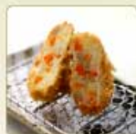
野菜コロッケ 1個 260円 【卵・乳成分・小麦】