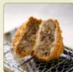
肉じゃがコロッケ 1個 260円 【卵・乳成分・小麦】