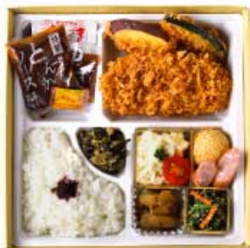
しょうぶ 菖蒲弁当 1,600円 (季節のおばんざいと、ヒレかつ) 【卵・乳成分・小麦】

春夏秋冬、 季節のめぐみをおばんざいに、 自慢のとんかつに添えた バランスの良いお弁当です。 京都の四季も堪能できる お弁当、会議やお宅でも。