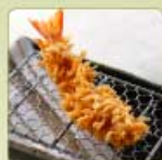
海老かつ 1尾 380円 【卵・乳成分・小麦・えび】