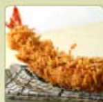
大海老かつ 1尾 980円 【卵・乳成分・小麦・えび】