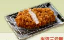
ロースかつ 80g 700円 120g 1,000円 160g 1,300円 【卵・乳成分・小麦】