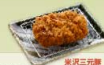
ヒレかつ 40g 600円 80g 900円 120g 1,200円 160g 1,500円 【卵・乳成分・小麦】