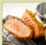
サーモンかつ 60g 560円 【卵・乳成分・小麦】