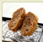
ミンチかつ 1個 420円 【卵・乳成分・小麦】