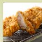
南部どり 鶏ももかつ 【岩手県産】 120g 1,580円 【卵・乳成分・小麦】