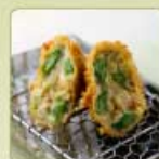
季節の豆乳コロッケ 1個 420円 【卵・乳成分・小麦】