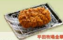
国産 平田牧場金華豚 ヒレかつ ヒレかつ 90g 1,100円 120g 2,100円 120g 1,400円 160g 2,700円 160g 1,700円 200g 3,300円 【卵・乳成分・小麦】