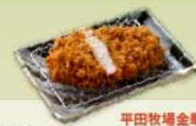
国産 平田牧場金華豚 ロースかつ ロースかつ 120g 1,200円 120g 2,000円 160g 1,500円 160g 2,600円 200g 3,200円 【卵・乳成分・小麦】