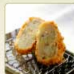
豚そぼろコロッケ 1個 260円 【卵・乳成分・小麦】