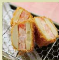
筍の海老はさみかつ 1個 780円 【卵・乳成分・小麦・えび】