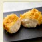
蟹クリームコロッケ 1個 560円 【卵・乳成分・小麦・えび・かに】