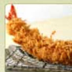
大海老かつ 1尾 980円 【卵・乳成分・小麦・えび】