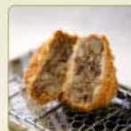
肉じゃがコロッケ 1個 260円 【卵・乳成分・小麦】