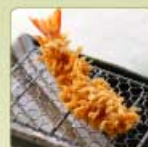
海老かつ 1尾 380円 【卵・乳成分・小麦・えび】