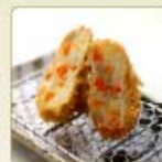
野菜コロッケ 1個 260円 【卵・乳成分・小麦】