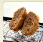
ミンチかつ 1個 420円 【卵・乳成分・小麦】