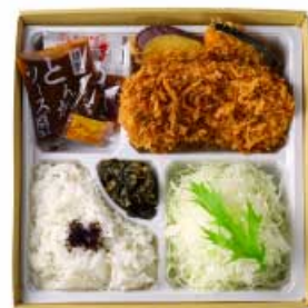
国産 平田牧場金華豚 ヒレかつ弁当 ヒレかつ弁当 90g 1,400円 120g 2,400円 120g 1,700円 160g 3,000円 160g 2,000円 200g 3,600円 【卵・乳成分・小麦】