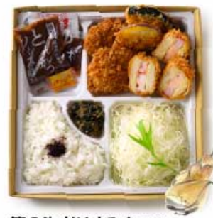
筍の海老はさみかつと 国産ヒレかつ弁当 1,980円 【卵・乳成分・小麦・えび】