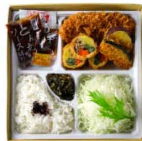
季節野菜の湯葉巻きかつと 国産ヒレかつ弁当 1,760円 【卵・乳成分・小麦】