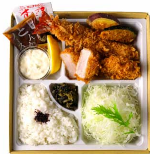
かつら弁当 2,080円 (大海老かつ・国産ヒレかつ) 【卵・乳成分・小麦・えび】

自慢のとんかつに、 ぶりぶりの大海老かつを 添えました。 かつらの味を 堪能できるお弁当、 会議やお宅でも。