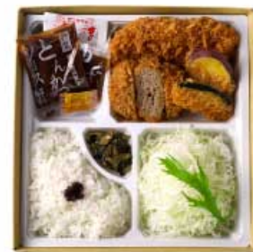
ミンチかつと 国産ヒレかつ弁当 1,820円 【卵・乳成分・小麦】