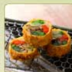
野菜の湯葉巻きかつ 1個 460円 【卵・乳成分・小麦】