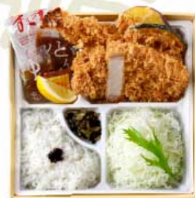
平田牧場 金華豚 ロースかつと 大海老かつ弁当 3,200円 【卵・乳成分・小麦・えび】

自慢のとんかつに、 ぶりぶりの大海老かつを 添えました。 かつらの味を 堪能できるお弁当、 会議やお宅でも。