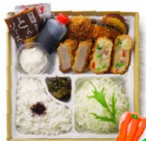
夏野菜と生ベーコンの 豆乳クリームコロッケと おろしヒレかつ弁当 1,620円 【卵・乳成分・小麦】

自慢のとんかつに、 ぶりの大海老かつを添えました。 かつらの味を堪能できるお弁当、 会議や自宅でも。