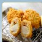
帆立かつ【青森県産】 1個 150円 【卵・乳成分・小麦】