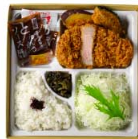
霧島山麓 SPF 豚 ロースかつ弁当 80g 1,000円 120g 1,300円 160g 1,600円 霧島山麓 SPF 豚 ロースかつ弁当 80g 1,300円 120g 1,700円 160g 2,100円 【卵・乳成分・小麦】