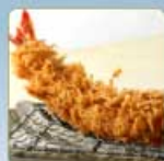
大海老かつ 1尾 980円 【卵・乳成分・小麦・えび】