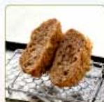
ミンチかつ 1個 420円 【卵・乳成分・小麦】