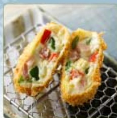
夏野菜と生ベーコンの 豆乳クリームコロッケ 1個 420円 【卵・乳成分・小麦】