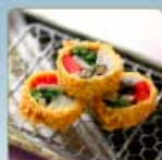
野菜の湯葉巻きかつ 1個 460円 【卵・乳成分・小麦】