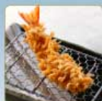
海老かつ 1尾 380円 【卵・乳成分・小麦・えび】