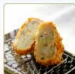
豚そぼろコロッケ 1個 260円 【卵・乳成分・小麦】