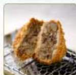
肉じゃがコロッケ 1個 260円 【卵・乳成分・小麦】