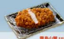
霧島山麓 SPF 豚 ロースかつ 80g 700円 120g 1,000円 160g 1,300円 霧島山麓 SPF 豚 ロースかつ 80g 1,000円 120g 1,400円 160g 1,800円 【卵・乳成分・小麦】