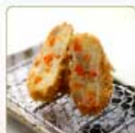
野菜コロッケ 1個 260円 【卵・乳成分・小麦】