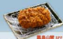
霧島山麓 SPF 豚 ヒレかつ 40g 600円 80g 900円 120g 1,200円 160g 1,500円 霧島山麓 SPF 豚 ヒレかつ 80g 1,140円 120g 1,540円 160g 1,940円 【卵・乳成分・小麦】