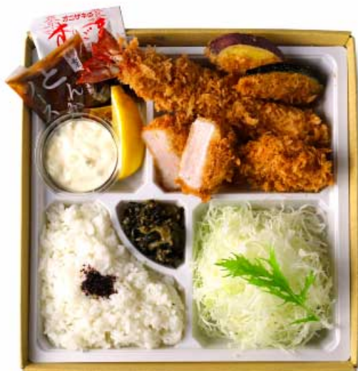
かつら弁当 1,980円 (大海老かつ・ヒレかつ) 【卵・乳成分・小麦・えび】

自慢のとんかつに、 ぶりの大海老かつを添えました。 かつらの味を堪能できるお弁当、 会議や自宅でも。