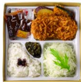
霧島山麓 SPF 豚 ヒレかつ弁当 80g 1,200円 120g 1,500円 160g 1,800円 霧島山麓 SPF 豚 ヒレかつ弁当 80g 1,440円 120g 1,840円 160g 2,240円 【卵・乳成分・小麦】