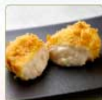
蟹クリームコロッケ 1個 560円 【卵・乳成分・小麦・えび・かに】