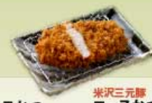
ロースかつ 米沢三元豚 80g 700円 120g 1,000円 160g 1,300円 ロースかつ 80g 1,000円 120g 1,400円 160g 1,800円 【卵・乳成分・小麦】