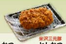
ヒレかつ 米沢三元豚 40g 600円 80g 900円 120g 1,200円 160g 1,500円 ヒレかつ 80g 1,140円 120g 1,540円 160g 1,940円 【卵・乳成分・小麦】