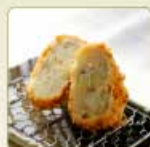
豚そぼろコロッケ 1個 260円 【卵・乳成分・小麦】