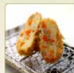
野菜コロッケ 1個 260円 【卵・乳成分・小麦】