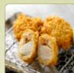
帆立かつ【青森県産】 1個 150円 【卵・乳成分・小麦】