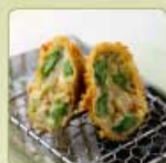
季節の豆乳コロッケ 1個 420円 【卵・乳成分・小麦】