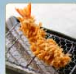
海老かつ 1尾 380円 【卵・乳成分・小麦・エビ】