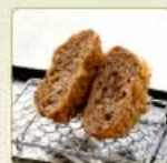
ミンチかつ 1個 420円 【卵・乳成分・小麦】