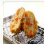
野菜コロッケ 1個 260円 【卵・乳成分・小麦】