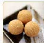
ごま団子 3個 200円 【卵・乳成分・小麦】