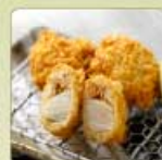
帆立かつ【青森県産】 1個 150円 【卵・乳成分・小麦】