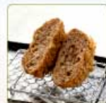
ミンチかつ 1個 420円 【卵・乳成分・小麦】