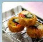
野菜の湯葉巻きかつ 1個 460円 【卵・乳成分・小麦】