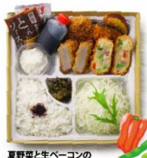
夏野菜と生ベーコンの 豆乳クリームコロッケと おろしヒレかつ弁当 1,720円 【卵・乳成分・小麦】