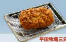
平田牧場三元豚 ヒレかつ 80g 1,000円 120g 1,300円 160g 1,600円 【卵・乳成分・小麦】