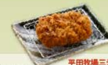
平田牧場三元豚 ヒレかつ 80g 1,000円 120g 1,300円 160g 1,600円 【卵・乳成分・小麦】