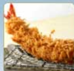
大海老かつ 1尾 980円 【卵・乳成分・小麦・エビ】