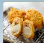
帆立かつ【青森県産】 1個 150円 【卵・乳成分・小麦】