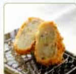
豚そぼろコロッケ 1個 260円 【卵・乳成分・小麦】