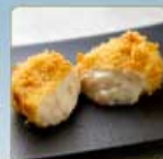
蟹クリームコロッケ 1個 560円 【卵・乳成分・小麦・エビ・かに】