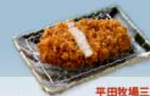
平田牧場三元豚 ロースかつ 120g 1,100円 160g 1,400円 【卵・乳成分・小麦】