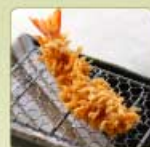
海老かつ 1尾 380円 【卵・乳成分・小麦・えび】