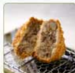
肉じゃがコロッケ 1個 260円 【卵・乳成分・小麦】