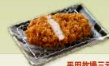
平田牧場三元豚 ロースかつ 120g 1,100円 160g 1,400円 【卵・乳成分・小麦】