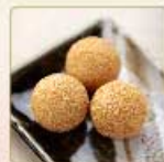
ごま団子 3個 200円 【卵・乳成分・小麦】