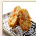
野菜コロッケ 1個 260円 【卵・乳成分・小麦】