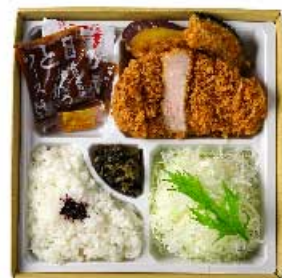
ローズかつ弁当 米沢三元豚 80g 1,000円 120g 1,300円 160g 1,600円 ローズかつ弁当 80g 1,300円 120g 1,700円 160g 2,100円 【卵・乳成分・小麦】