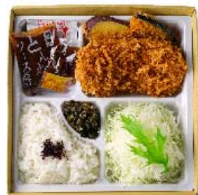
ヒレかつ弁当 米沢三元豚 80g 1,200円 120g 1,500円 160g 1,800円 ヒレかつ弁当 80g 1,440円 120g 1,840円 160g 2,240円 【卵・乳成分・小麦】