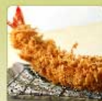
大海老かつ 1尾 980円 【卵・乳成分・小麦・えび】