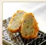
豚そぼろコロッケ 1個 260円 【卵・乳成分・小麦】