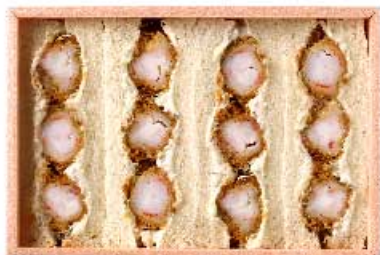
海老かつサンド 1,100円 【卵・乳成分・小麦・えび】