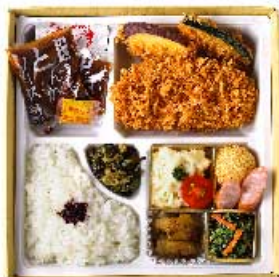
しょうぶ 菖蒲弁当 1,500円 (季節のおばんざいと、ヒレかつ) 【卵・乳成分・小麦】

春夏秋冬、 季節のめぐみをおばんざいに、 自慢のとんかつに添えた バランスの良いお弁当です。 京都の四季も堪能できる お弁当、会議やご自宅でも。