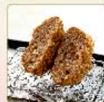
ミンチかつ 1個 420円 【卵・乳成分・小麦】