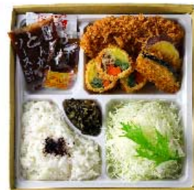
季節野菜の湯葉巻きかつと ヒレかつ弁当 1,560円 【卵・乳成分・小麦】