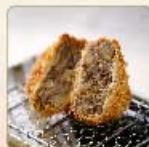
肉じゃがコロッケ 1個 260円 【卵・乳成分・小麦】