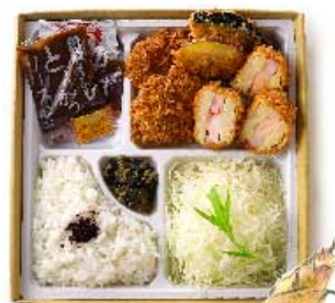
旬の海老はさみかつと ヒレかつ弁当 1,780円 【卵・乳成分・小麦・えび】