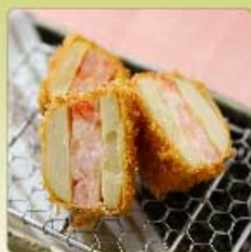
旬の海老はさみかつ 1個 780円 【卵・乳成分・小麦・えび】