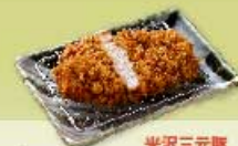
ローズかつ 米沢三元豚 80g 700円 120g 1,000円 160g 1,300円 ローズかつ 80g 1,000円 120g 1,400円 160g 1,800円 【卵・乳成分・小麦】