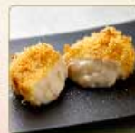
蟹クリームコロッケ 1個 460円 【卵・乳成分・小麦・えび・かに】