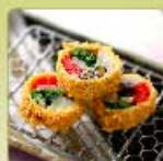
野菜の湯葉巻きかつ 1個 460円 【卵・乳成分・小麦】