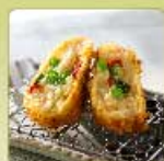
季節の豆乳コロッケ 1個 420円 【卵・乳成分・小麦】