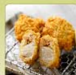
帆立かつ【青森県産】 1個 150円 【卵・乳成分・小麦】