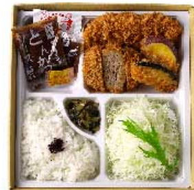
ミンチかつとヒレかつ弁当 【卵・乳成分・小麦】 1,620円