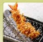
海老かつ 1尾 380円 【卵・乳成分・小麦・えび】