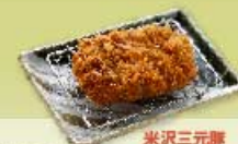
ヒレかつ 米沢三元豚 40g 600円 80g 900円 120g 1,200円 160g 1,500円 ヒレかつ 80g 1,140円 120g 1,540円 160g 1,940円 【卵・乳成分・小麦】