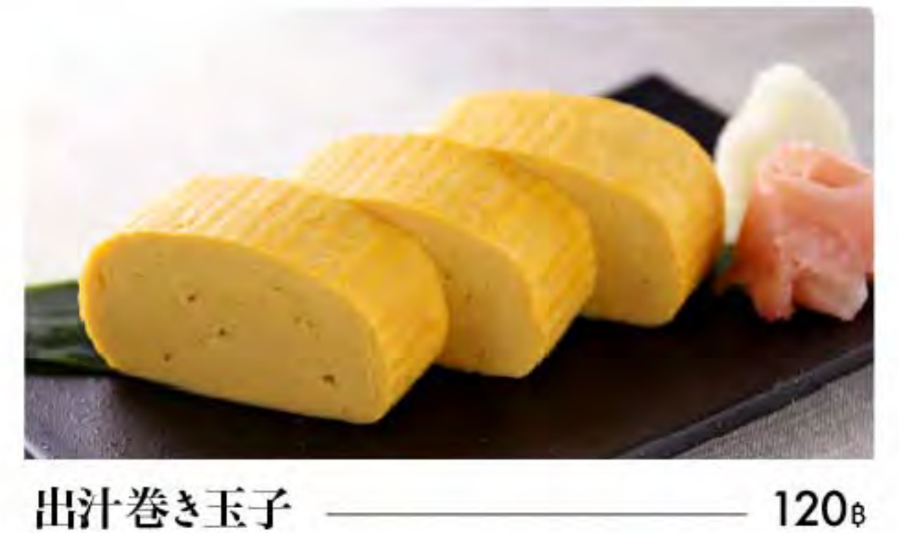
出汁巻き玉子 — lapanese omelette

お子さま かつ・ ででででは、 tard Kids plate (cutlets m