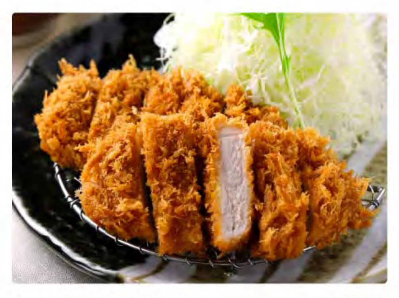
特上黒豚盛り合わせ(ロースとヒレ)かつ膳 620฿ ชุดรวมทงคัตสึคุโระบุตะสันนอกและสันใน Premium pork tenderloin and loin cutlet set meal