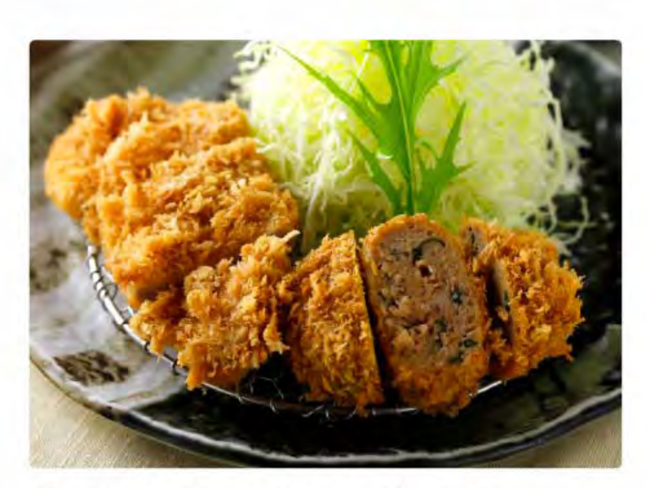
青じそミンチかつとヒレかつ膳 490g ชุดคัตสึหมูบดใบชิโสะและทงคัตสึสันใน Pork mince with perilla and pork tenderloin cutlet set meal