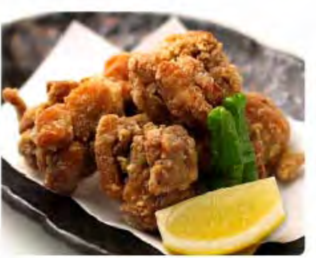
鶏の唐揚げ——180฿ ไก่ทอดคาราเกะ Juicy fried chicken