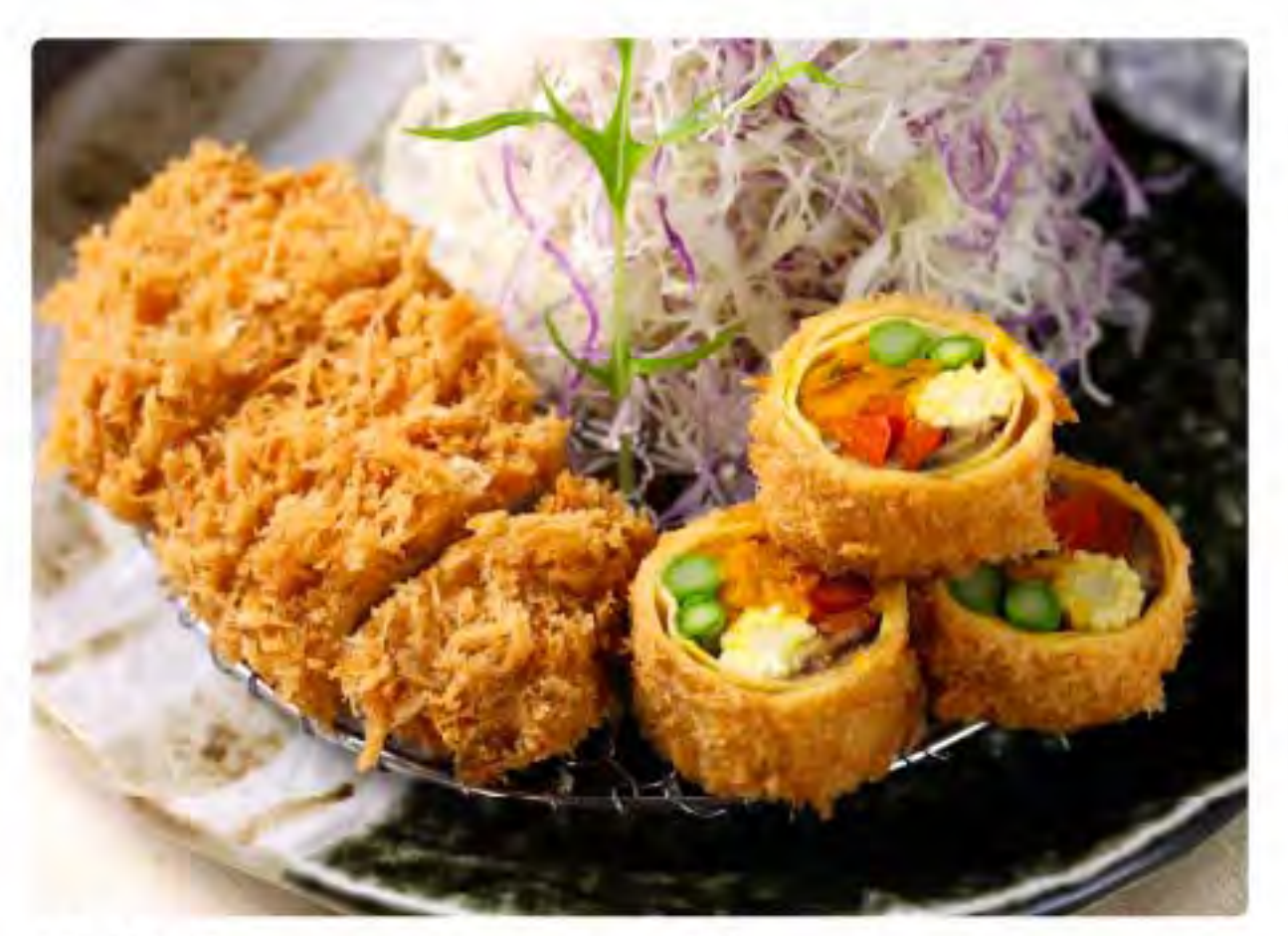
湯葉巻きかつとヒレかつ膳 — 490g (アスパラガス・ヤングコーン・赤パプリカ・南瓜・椎茸) ชุดคัตสึฟองเต้าหู้ห่อผักและคัตสึหมูสันใน (หน่อไม้ฝรั่ง, ข้าวโพดอ่อน, พริกปาปริก้าแดง, ฟักทอง, เห็ดหอม) Yuba rolled vegetables cutlet and Berkshire pork tenderloin cutlet set meal (asparagus, young corn, paprika, squash and Shitake)