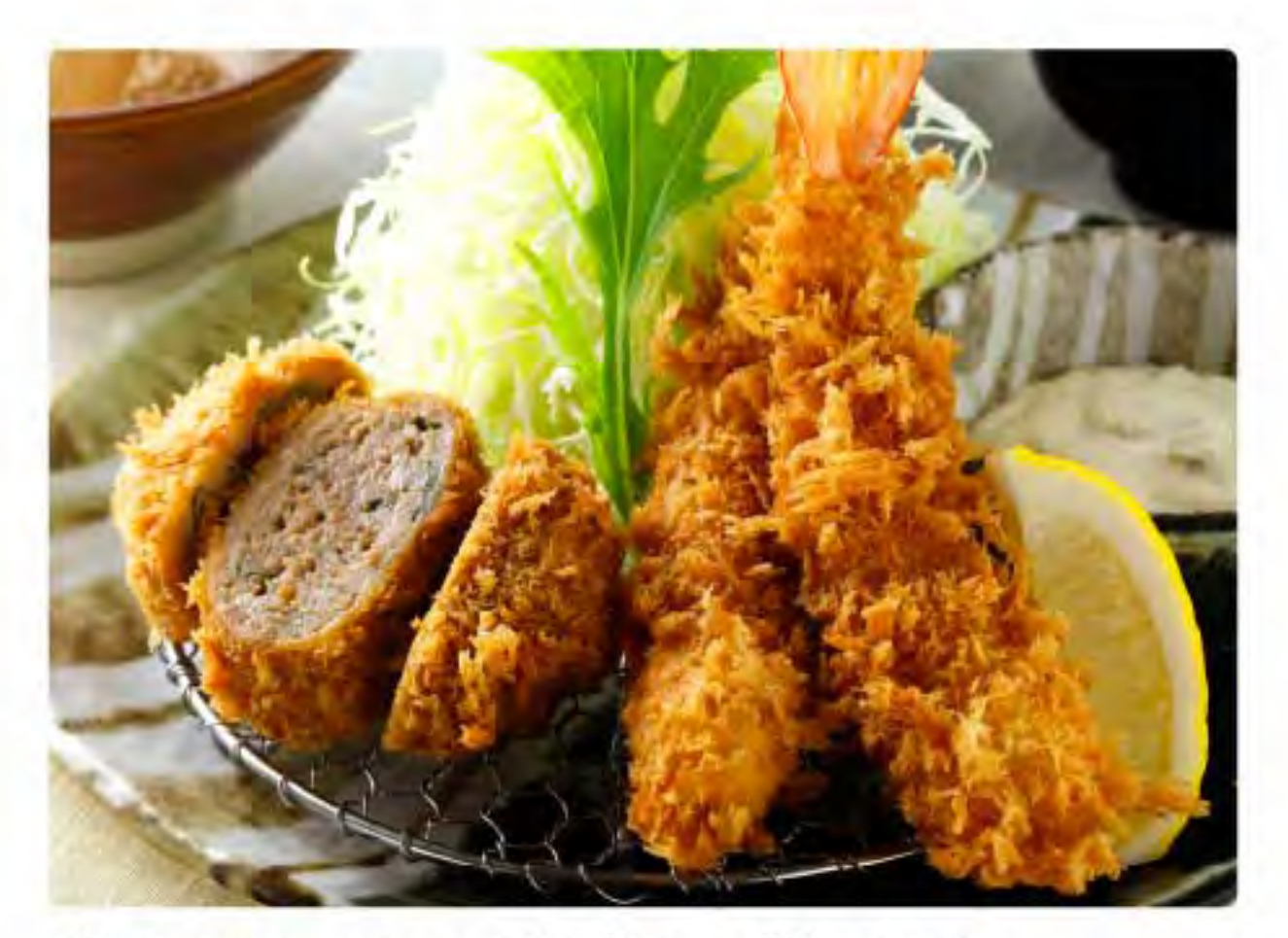
青じそミンチかつと海老かつ膳 520® ชุดคัตสึหมูบดใบชิโสะและคัตสึกุ้ง Pork mince with perilla and shrimp cutlet set meal