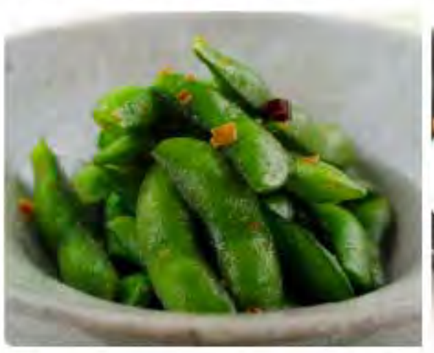
枝豆 — 908 ごま油・にんにく・唐辛子 ถั่วแระญี่ปุ่นสไปชื่ Edamame (green soybeans)